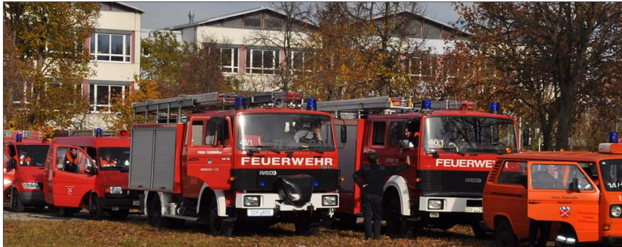
Warten auf Abmarsch: 18 Wehren aus dem Landkreis trafen sich am Volksfestplatz in Landau gegenüber des Gymnasiums.